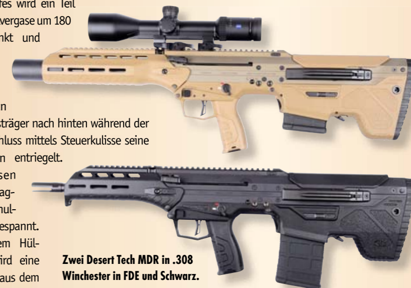
Zwei Desert Tech MDR in .308 Winchester in FDE und Schwarz.

Den Hülsenauswurf hat sich Desert Tech von Bordgeschützen abgeschaut, denn das Messing der abgefeuerten Patronen wird nach vorne ausgeworfen (FE = Front Ejection). Je nachdem auf welcher Seite der Auswurf-schacht montiert wurde, können somit auch Linkshänder die Waffe bedenkenlos benutzen. Der Umbau geschieht werkzeuglos. Damit die Kaliberzuordnung eingehalten wird, ist jeder Schacht außen mit einer Kaliberangabe versehen. Ein federbelasteter Staubschutzdeckel verhindert, dass grober Schmutz ins System eindringen kann. Zugegeben, die Kniegelenk-mechanik des Hülsenauswurfs wirkt sehr komplex, funktionierte in der Praxis aber ohne Fehl