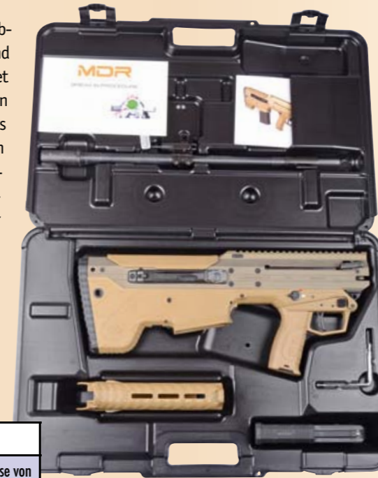
Kompakte Diskretion: Die Waffe wird in einem schwarzen Kunststoffkoffer ausgeliefert. Bei seinen Abmessungen von 58x39x11,5 cm würde niemand vermuten, dass sich darin ein präzises Selbstladegewehr verbirgt.