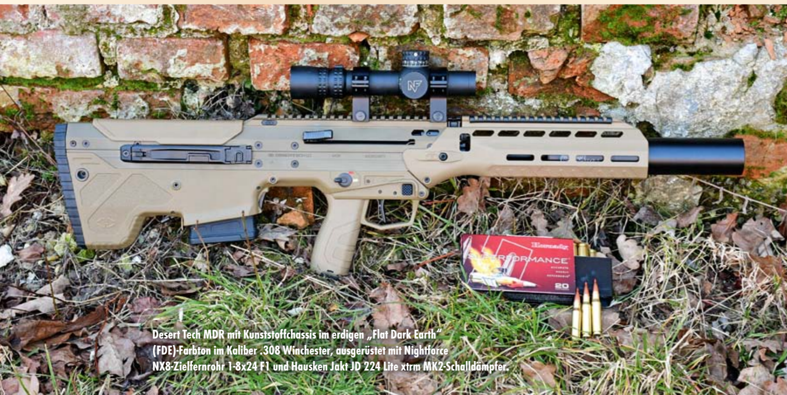
Desert Tech MDR mit Kunststoffchassis im erdigen „Flat Dark Earth“ (FDE)-Farbton im Kaliber .308 Winchester, ausgerüstet mit Nightforce NX8-Zielfernrohr 1-8x24 F1 und Hausken Jakt JD 224 Lite xtrm MK2-Schalldämpfer.

„In der Kürze liegt die Würze“ trifft auf die innovativen Multikaliber-Halbbautomaten in Bullpup-Bauweise des US-Unternehmens Desert Tech aus West Valley City, Utah, definitiv zu. Wir haben die kompakten MDR-Kraftzwerge erprobt.