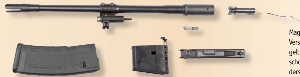
Umbausatz in .223 Remington mit Lauf mit Wylde-Patronenlager, Magazin, Auswerfeinheit, Magazinadapter und Magazineinsatz.

wieder Verbesserungen erfahren; so wurde aufgrund von Anwenderfeedback 2019 das Gas- und Hülsenauswurfsystem überarbeitet, um die Munitionsverträglichkeit ohne notwendige Manipulationen an der verstellbaren Gasentnahmeeinheit zu erhöhen, wobei dieses Update als „Generation 2 MDR Gas System“ bezeichnet wird. Im Januar 2021 präsentierte Desert Tech einen „Micron“-Umbausatz mit 11,5“-Lauf und kurzem Handschutz, mit dem standardmäßige MDR/MDRX-Modelle in „Short Barreled Rifles“ (SBR) umgerüstet werden können, was besonders für den einheimischen US-Markt und seine eigenen Gesetze interessant ist. Schließlich folgte als letzte MDR-Neuheit im März dieses Jahres der Aluminium-Handschutz „Mantis“ mit integrelem, ausklappbarem Zweibein.