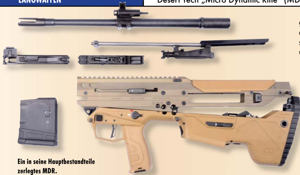
Ein in seine Hauptbestandteile zerlegtes MDR.

und Tadel. Es wird für Modelle im Kaliber .223 Remington auch ein seitlicher Hülsenauswurf (SE = Side Ejection) offeriert. Hier steht die im Anschaffungspreis dann günstigere Komplettwaffe oder auch ein Umbausatz zur Auswahl. Unsere Testwaffe im Kaliber .308 Win. mit .223 Rem.-Wechselsystem war mit 16" Laufängen ausgerüstet, wobei die Drallängen in .308 Win. 1-10" und in .223 Rem. 1-8" betragen. Es gibt die MDR standardmäßig aber auch mit 20"-Läufen sowie in anderen Kalibern wie .300 Blackout und 6,5 Creedmoor.