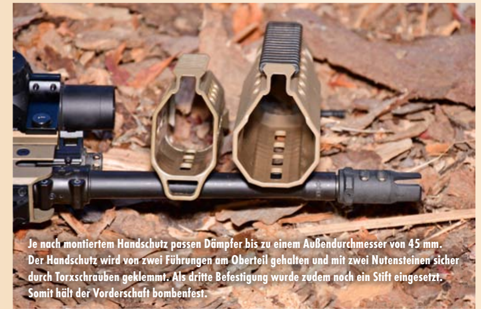
Je nach montiertem Handschutz passen Dämpfer bis zu einem Außendurchmesser von 45 mm. Der Handschutz wird von zwei Führungen am Oberteil gehalten und mit zwei Nutensteinen sicher durch Torxschrauben geklemmt. Als dritte Befestigung wurde zudem noch ein Stift eingesetzt. Somit hält der Vorderschaft bombenfest.

nen Schalldämpfer. Aufgrund der Kontur des Handschutzes kann kein Overbarrel-Dämpfer verwendet werden. Aber auch hierfür hat Desert Tech eine Lösung. Wird der optional erhältliche breite Vorderschaft verwendet, können Overbarrel-Dämpfer bis zum einem Außendurchmesser von 45 mm montiert werden. Im Test verwendeten wir einen Hausken Jakt JD 224 Lite xtrm MK2, der sich hervorragend ins Gesamtsystem einfügte. Dazu passt die auf der ganzen Länge verlaufende MIL-STD-1913-Montageschiene (Systemgehäuse, Gasblock, Handschutz) auf der Waffenoberseite, denn so ist ausreichend Platz für das Anbringen von Optiken und eventuellen Vorsatzgeräten (Nachtsicht, Thermal) vorhanden. Auch die weitere praxisnahe Ausstattung