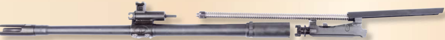
In Linie (von links): Lauf mit Mündungsfeuerdämpfer und mittig angeordnetem Gasblock. Im Block sitzen das verstellbare Gasventil und der Gaskolben. Rechts das Gasgestänge mit Vorholfeder sowie der Verschluss.

Die verstellbare Gasentnahme besitzt sechs Positionen und das MDR ist damit schon optimal für eine etwaige Schalldämpfernutzung vorbereitet. Wird der Dreifinger-Mündungsfeuerdämpfer abgenommen, was sich dank zweier Schlüsselflächen (SW 19 mm) schnell bewerkstelligen lässt, bietet das nun zum Vorschein kommende Gewinde \frac{3}{8} -24 die perfekte Schnittstelle für ei-