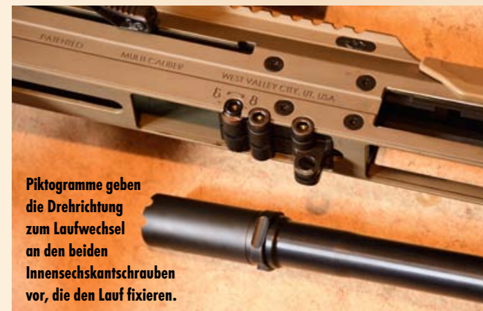
Piktogramme geben die Drehrichtung zum Laufwechsel an den beiden Innensechskantschrauben vor, die den Lauf fixieren.

mit dem Modell Micro Dynamic Rifle eXtreme (MDRX) eine ganz aktuelle Nachfolgenera-tion, die in den Bereichen des widerstands-fähigen Polymerkunststoffs für das Griffstück, der Abzugseinheit, des Gasblocks und Kompensators verbessert wurde. Für den Test stand uns aber die MDR-Vorgängerserie zur Verfügung. Generell hat die Baureihe immer