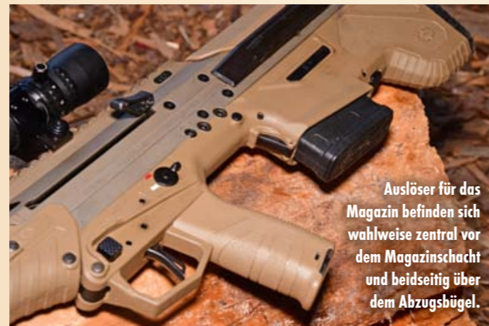
Auslöser für das Magazin befinden sich wahlweise zentral vor dem Magazinschacht und beidseitig über dem Abzugsbügel.