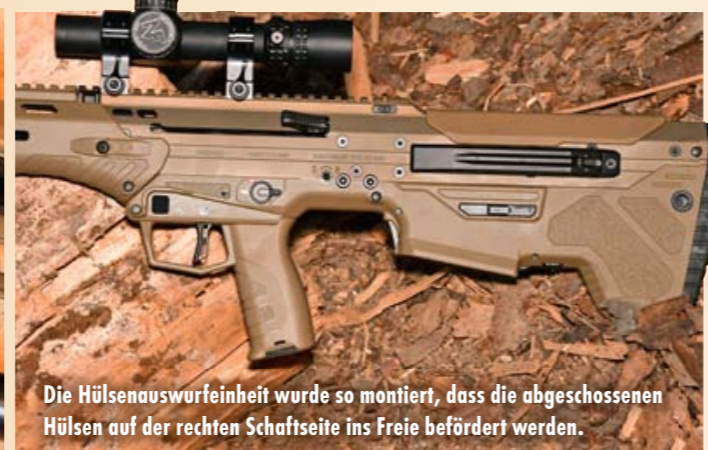
Die Hülsenauswurfeinheit wurde so montiert, dass die abgeschossenen Hülsen auf der rechten Schaftseite ins Freie befördert werden.