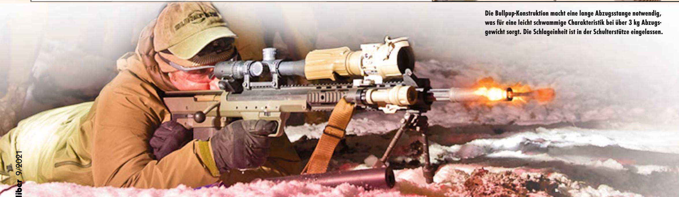
Desert Tech fertigt auch Repetiergewehre in Bullpup-Bauweise der Baureihen SRS (Stealth Recon Scout) und HTI (Hard Target Interdiction).