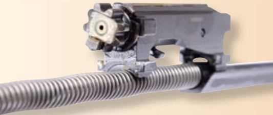
Das MDR ist ein indirekter Kurzhub-Gasdrucklader mit Multiwarzen-Drehkopfverschluss.

überzeugt: Eine QD-Buchse in der Schulterstütze ermöglicht die beidseitige Fixierung von Riemenbügeln/Tragegurt. Im Handschutz wurde eine Befestigungsmöglichkeit integriert, die gleichzeitig als Handstopp dient, um nicht vor die Mündung zu greifen.